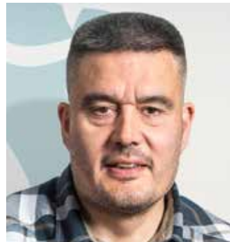
Kim Kielsen, forsætisráðherra Grænlands (2014-)

( https://www.highnorthnews.com/en/greenlands-premier-we-must-work-towards-independence )