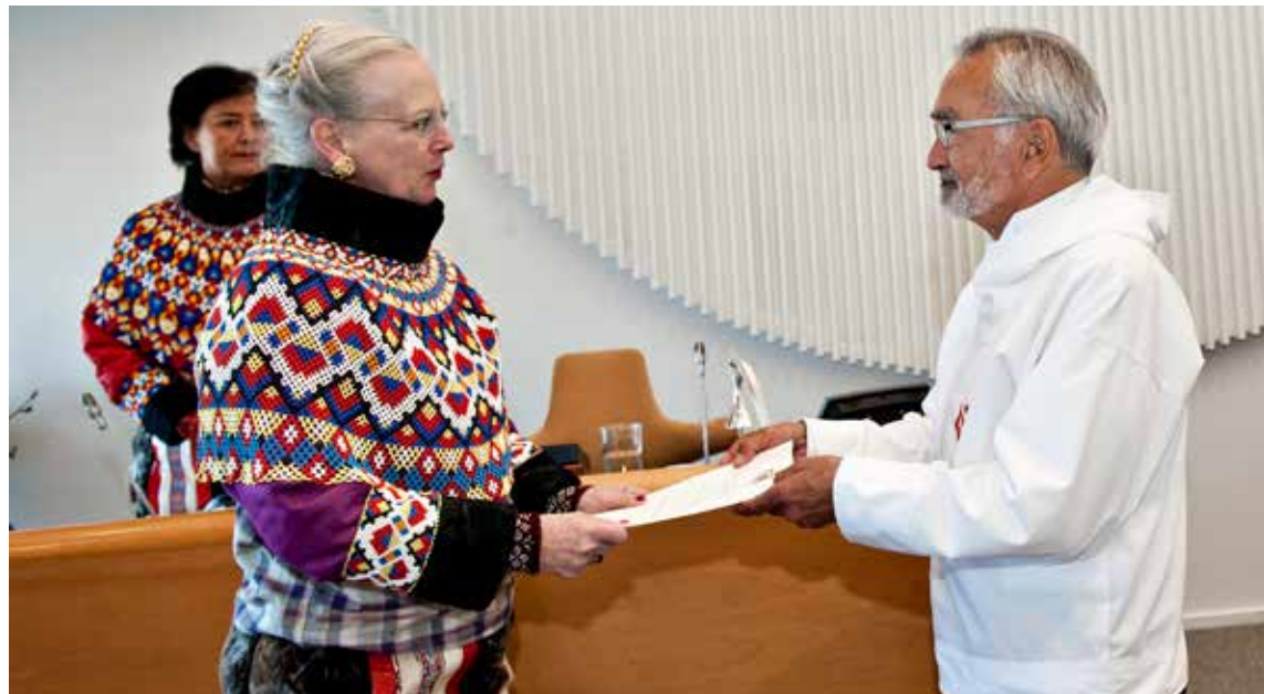
Margrét Þórhildur Danadrottning afhendir Josef Motzfeldt, forseta grænlenka þingsins, Inatsisartut, sjálfstjórnarlögin árið 2009

Grænland er á einbeittri leið til sjálfstæðis. Alþingi hefur fyrir hönd Íslands lýst fullum stuðningi við þau skref sem Grænendingar hafa tekið á þeirri leið. 47 Ekki er spurning um hvort, heldur hvenær og hvernig, sjálfstæði er náð. Gagnvart þeirri þróun hefur Ísland bæði hagsmuni og skyldur. Sjálfstæði Grænlands mun alltaf styrkja Ísland og gagnkvæmur ávinningur verður því meiri sem samvinna ríkjanna er nánari. Skyldurnar felast í því að Íslendingar búa yfir dýrmætri reynslu af því hvernig fámenn þjóð á Norðurslóðum byggir upp ríki á forsendum eigin tungu, menningar og auðlinda, og með eigin fólki. Þjóð í leiðangri til sjálfstæðis þarf á stuðningi og öflugum samstarfslöndum að halda. Grænendingum getur nýst reynsla Íslendinga ef þeir vilja og sterkari tengsl skapa farveg til að miðla henni þangað til fullu sjálfstæði er náð.