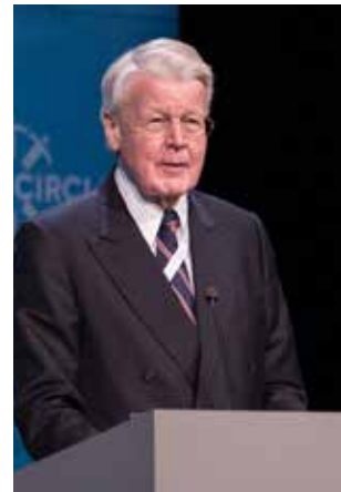
Ólafur Ragnar Grímsson, formaður Hringborðs Norðurslóða - Arctic Circle.

(Ólafur Ragnar Grímsson á fundi með Grænlandsnefnd.)