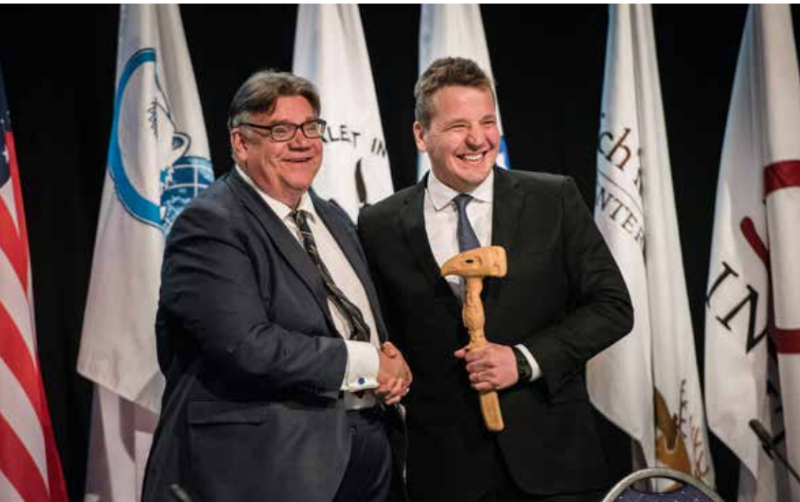
Guðlaugur Þór tekur við formennskukefli Norðurskautsráðsins af utanríkisráðherra Finnlands, Timo Soini, í Rovaniemi 2019.

Ein leið til að treysta stöðu á heimaslóð er að styrkja samstarfstengsl sem standa til boða við aðrar þjóðir og svæði utan Vestur-Norðurlanda. Fjöldmenn svæði sem tengjast Norðurlóðum sterkum böndum hafa á síðustu árum leitað eftir aukinni samvinnu við þjóðir vestnorræna svæðisins. Þar má nefna Québec og Nunavut-fylki í Kanada, bandarísku fylkin Alaska og Maine auk Skotlands. Öll hafa þau mjög sterka stöðu í heimalöndum sínum og myndað tengsl í gegnum Vestnorræna ráðið og Hringborð Norðurlóða – Arctic Circle. Öll hafa eigin sérstöðu gagnvart Norðurlóðum en eiga sameiginlegt að hafa sýnt vaxandi áhuga á að tengjast þeim gegnum smáþjóðirnar á vestnorræna svæðinu.