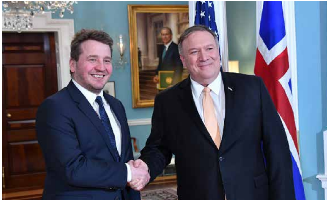
Utanríkisráðherrar Bandaríkjanna og Íslands, Mike Pompeo og Guðlaugur Þór Þórðarson, í Washington árið 2019.

staðfesti þann vilja á lokuðum fundi í Bandaríkjunum þar sem tveir öldunga- deildarþingmenn tóku málið upp og upplýsti að vinnuhópur á vegum stjórnar- innar væri að skoða málið. Í bakgrunnsmiðlun embættismanna til fjölmiðla voru umræður um fríverslun tengdar breyttum öryggisaðstæðum á Norður- slóðum og mögulegri þátttöku Íslands í Belti og braut. 38 Hin breytta nálgun gagn- vart Íslandi sýndi að í Washington skildu menn að Ísland hafði ný spil á hendi.